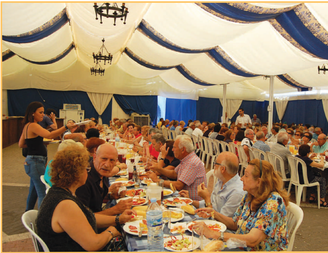
Convivencia de mayores en la Feria de Palmones de este año.