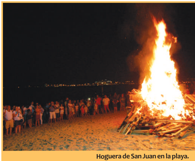
Hoguera de San Juan en la playa.