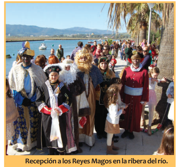
Recepción a los Reyes Magos en la ribera del río.