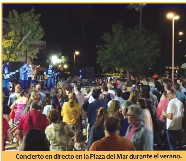
Concierto en directo en la Plaza del Mar durante el verano.