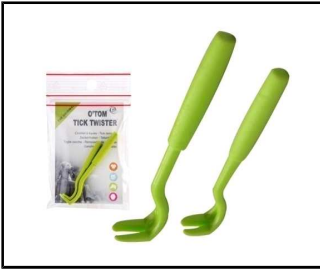
Imagen de otom tick twister