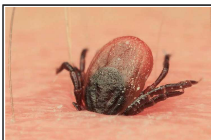
Imagen de garrapata adherida a la piel