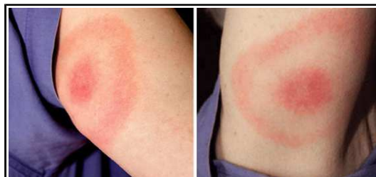
Imágenes de Eritema Migrans